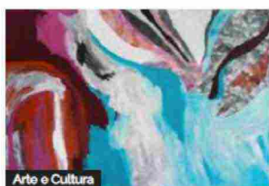
Arte e Cultura Sally Gabori alla Trienna...