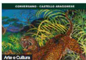
Arte e Cultura Antonio Ligabue al Castel...