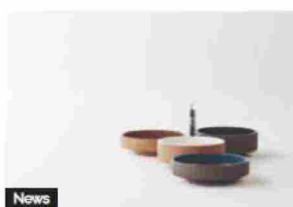
News Agape: lavabi materici di...