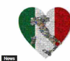
News Luoghi del cuore 2022: i ...