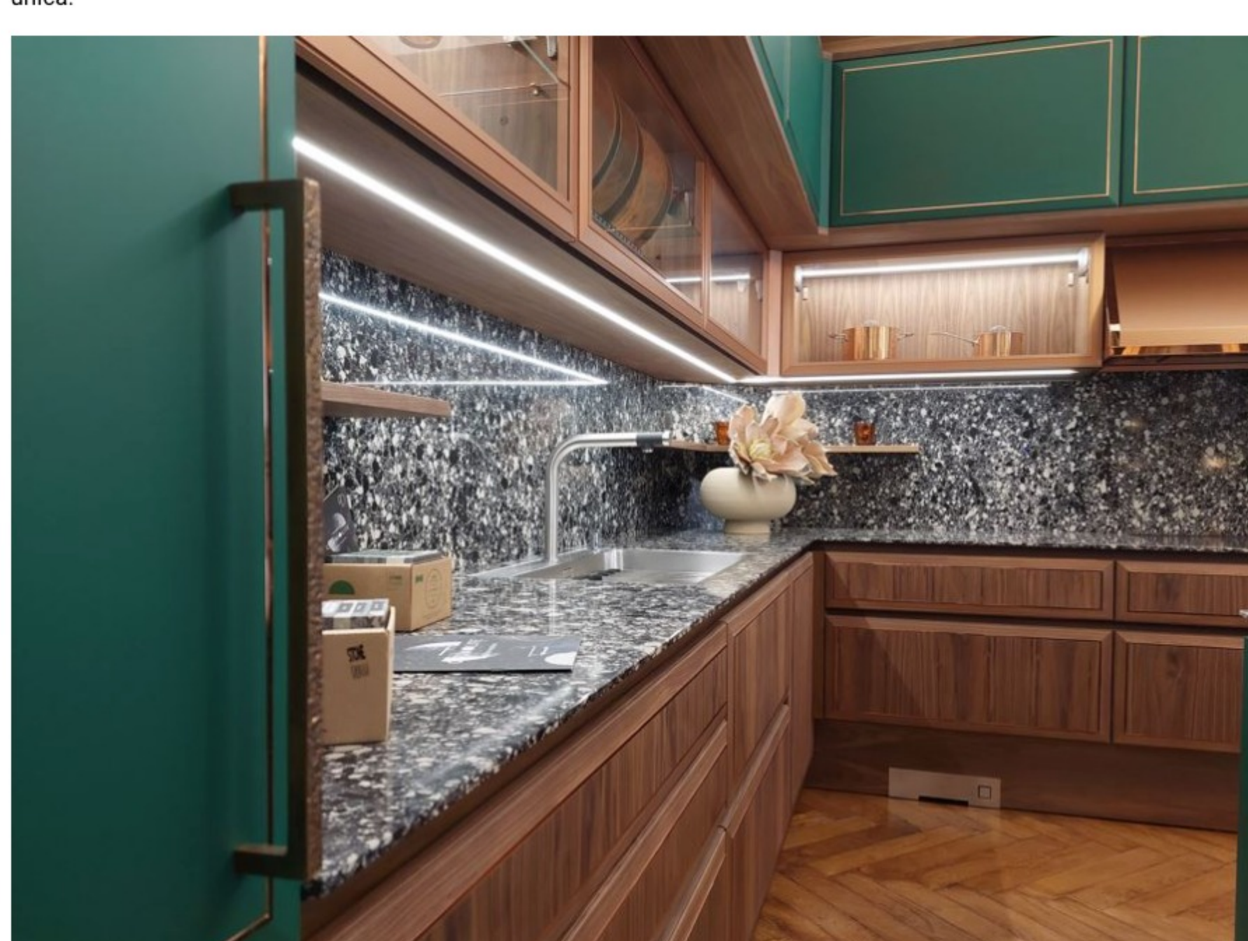
Essenza "Supernatural" è una composizione di cucina che pone in tecnologia, innovazione e sostenibilità le proprie fondamenta. La finitura Verde Giada super matte, oltre ad essere piacevolmente morbida al tatto, è sostenibile in quanto il processo di finitura è completamente realizzato con base acqua. La finitura Canaletto Dark, anch'essa a base acqua, è presentata sulle colonne e sul piano del bancone estraibile. Il tutto ben coordinato grazie all'inserimento della finitura rame e dalla maniglia abbinata. Gli interni sono in Canaletto Eco, che esalta la naturale venatura del legno ed è completamente naturale e atossica.