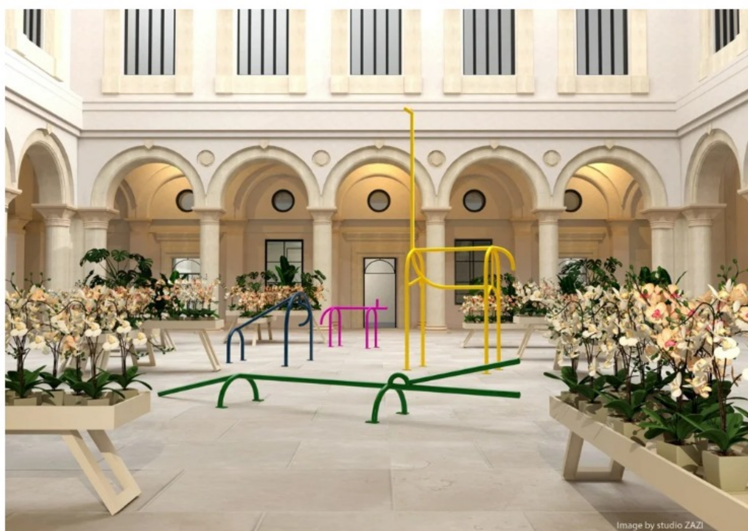
Masterly, the Dutch in Milano