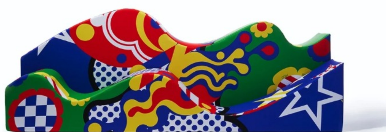
Superonda con il rivestimento Farfalla