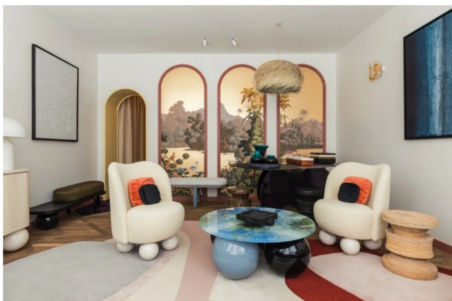
Le FRENCH DESIGN, Le Berre Veveaud

Per scoprire tutti gli eventi del distretto 5VIE, visitare il sito 5VIE.it