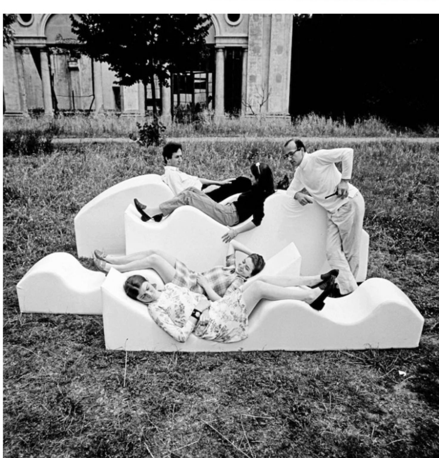
Archizoom e Superonda

Scopri e acquista il libro sulla Storia del Fuorisalone