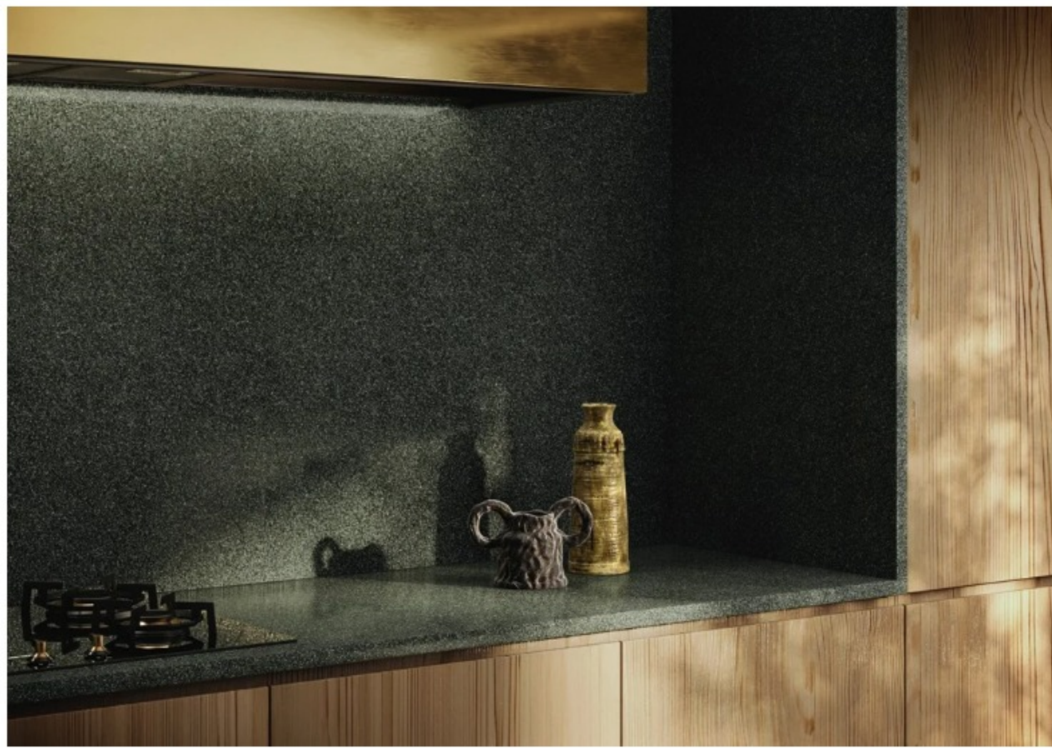
Cosmolite, di Stone Italiana

Stone Italiana presenta il nuovo materiale Cosmolite , in uno showroom temporaneo in via degli Arcimboldi 5. Cosmolite, le nuove superfici di Stone Italiana, sono formate da un impasto realizzato al 100% con inerti da riciclo pre-consumo, facile da lavorare, resistente e bello da vedere. Inoltre, Cosmolite si inserisce in un nuovo processo produttivo, ed è senza quarzo, dunque più sostenibile.